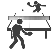
Tenis de masa