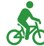
Mers cu bicicleta