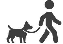
Plimbare cu cainele