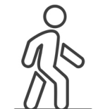
deplasări pe distanțe scurte în ritm lent